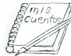
TENEMOS UNA HISTORIA

Entre los objetivos de la actividad está el estimular la imaginación y la inventiva de los niños a través del juego con las palabras, con su fonética y hasta con la sintaxis (ya se sabe que la creatividad vigoriza el dominio del cerebro en todas sus funciones). A la vez se busca robustecer el dominio del castellano, el modo de expresarlo -por escrito o de palabra-, de manera creativa y divertida. El taller también pretende la interacción entre los participantes a la hora de componer historias, de manera que el trabajo en equipo refuerce los vínculos del grupo así como la labor creadora individual. Se forman cuentos entre todos y en solitario, de forma oral y mediante la escritura, gracias a las técnicas y trucos que utilizan escritores y cuentacuentos.